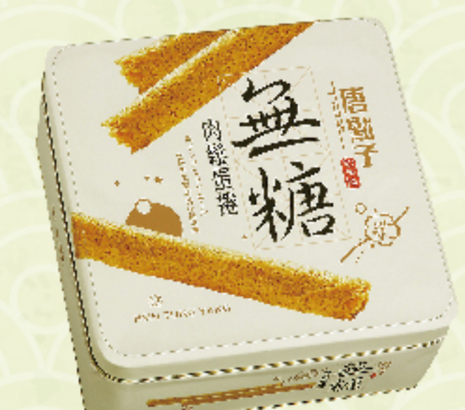
精緻肉鬆蛋捲禮盒-無糖 (9包入/盒) 特價 380 元 售價450元

◎無糖商品注意事項： 1.無糖商品是以糖醇代替砂糖，熱量較一般糖製作的產品少，但實際嚐起來仍有甜味。2.若飲食需嚴格控制之消費者，請依專科醫生建議及指示下食用。3.糖醇不易被人體吸收，若大量食用少數人可能有輕微腸胃不適等反應產生，屬正常現象，請酌量食用。