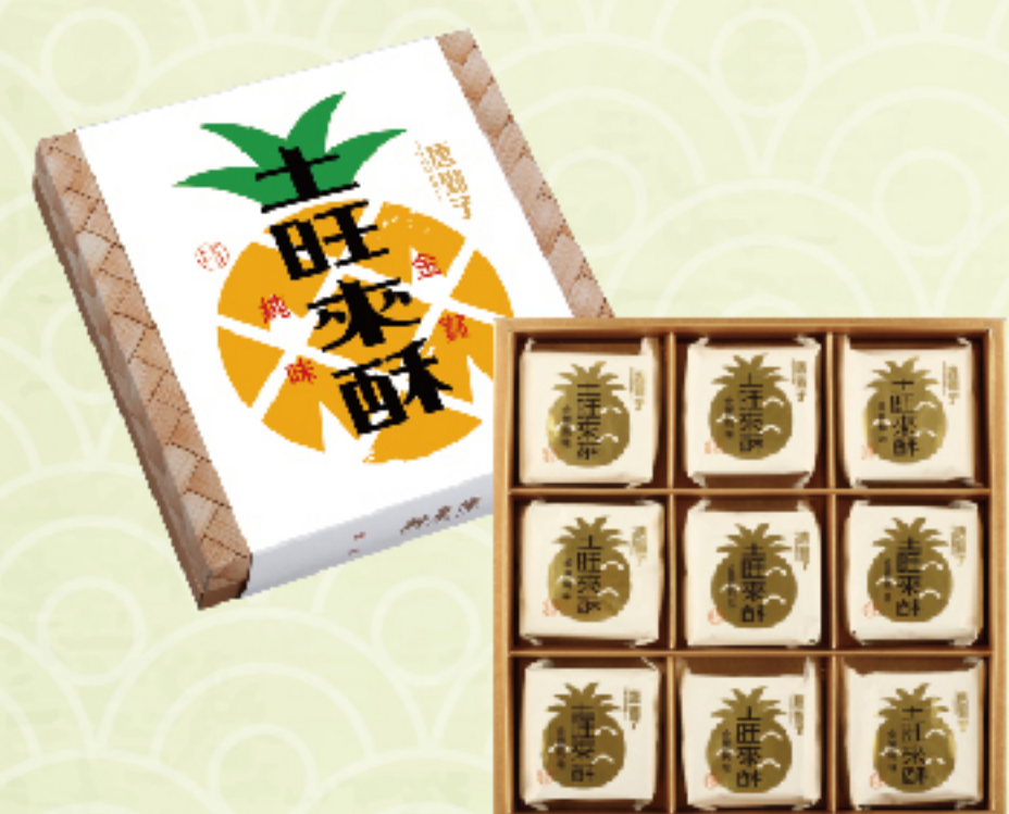
奶蛋素 土旺來酥 (9入/盒) 售價 450 元