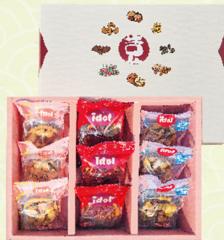
愛豆屋 綜合堅果塔禮盒 (9入/盒) 特價 479 元 售價500元 綜合堅果塔、胡桃塔 巧克力夏威夷豆塔