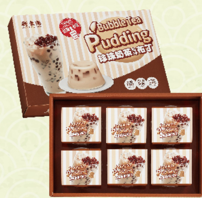
珍珠奶茶風味布丁 (6入/盒) 特價 199 元 售價235元 香濃奶茶 × Q彈黑糖蒟蒻 布丁茶、奶與珍珠的完美比例一口，吃下滿滿幸福。