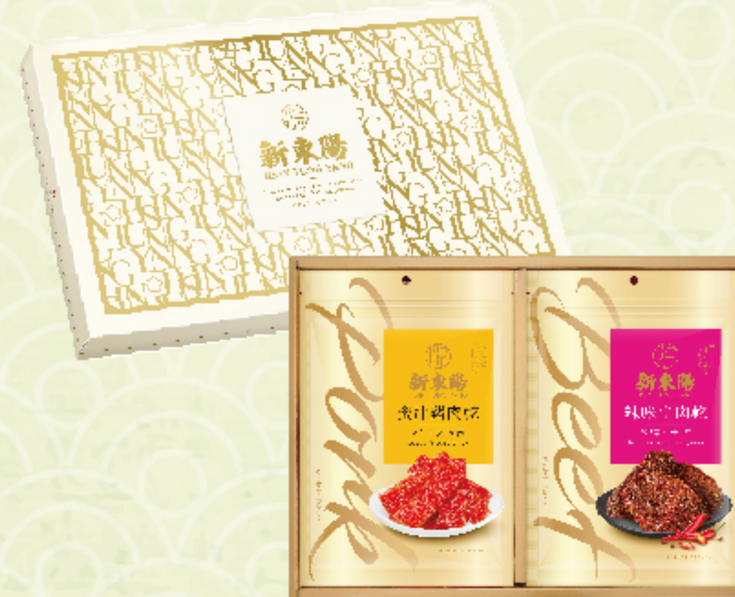
精緻肉品禮盒2號 售價 650 元 蜜汁豬肉乾、辣味牛肉乾