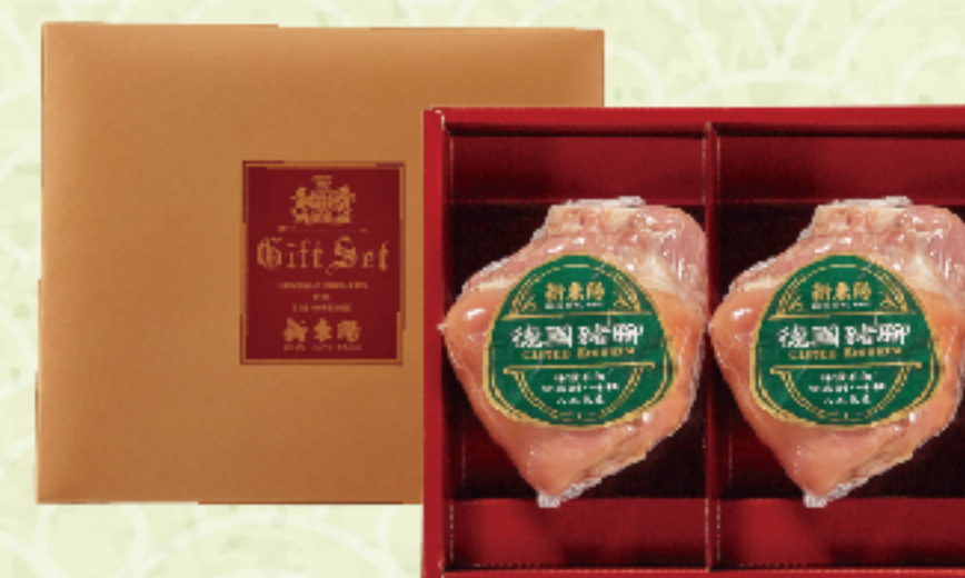
德國豬腳禮盒 需冷凍

黑豬三星蔥香腸 / 墨魚香腸 / 飛魚卵香腸 / 剝皮辣椒香腸 (360g/盒) 需冷凍 特價 260 元 售價285元