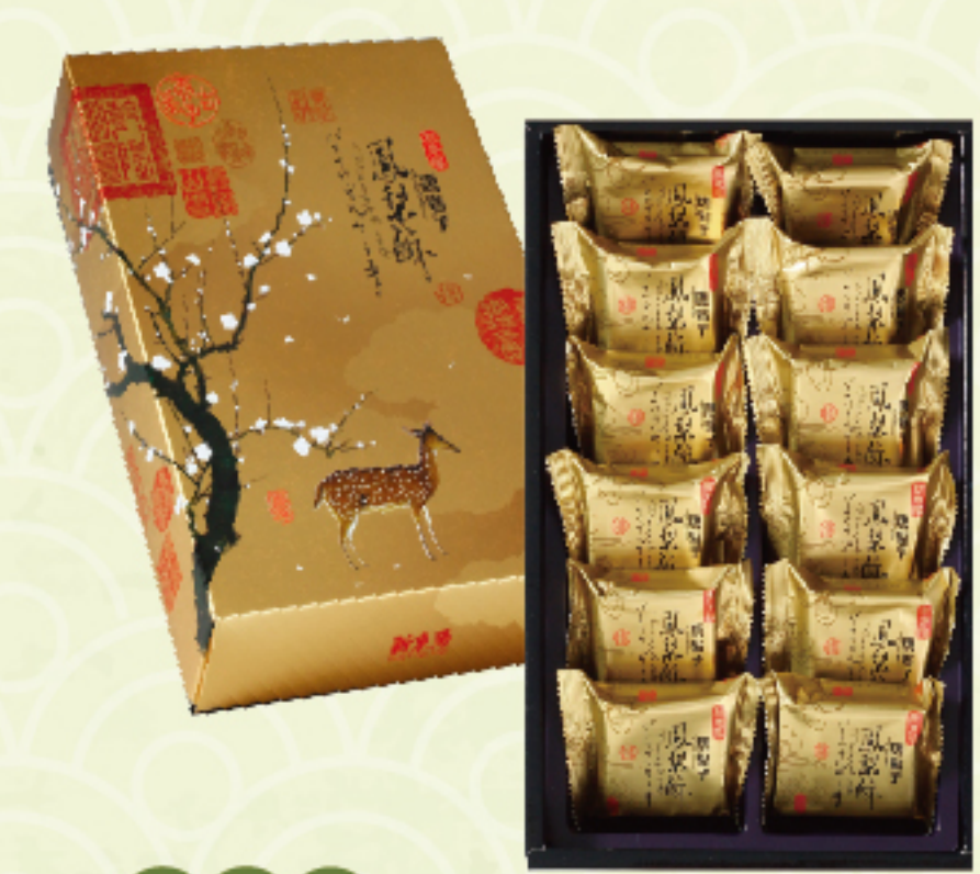
奶蛋素 精緻鳳梨酥禮盒 (12入/盒) 售價 420 元