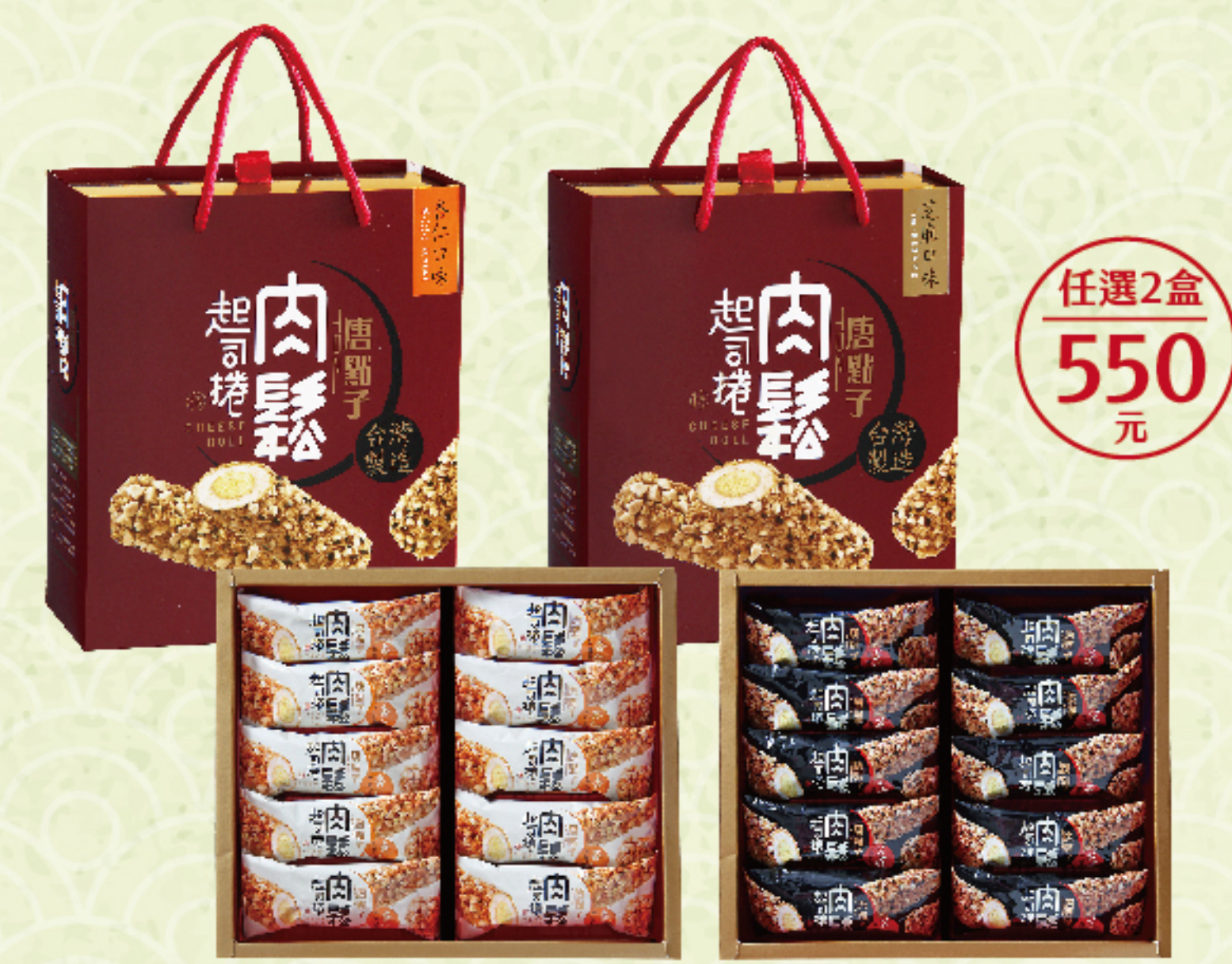
肉鬆起司捲禮盒-杏仁/芝麻 (20入/盒) 特價 280 元 售價320元

◎無糖商品注意事項： 1.無糖商品是以糖醇代替砂糖，熱量較一般糖製作的產品少，但實際嚐起來仍有甜味。2.若飲食需嚴格控制之消費者，請依專科醫生建議及指示下食用。3.糖醇不易被人體吸收，若大量食用少數人可能有輕微腸胃不適等反應產生，屬正常現象，請酌量食用。