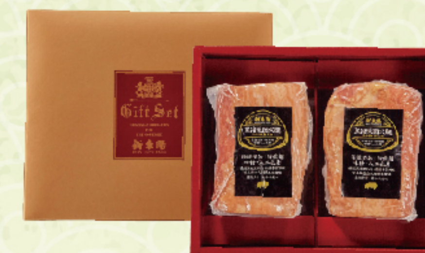
萊茵火腿禮盒 需冷藏