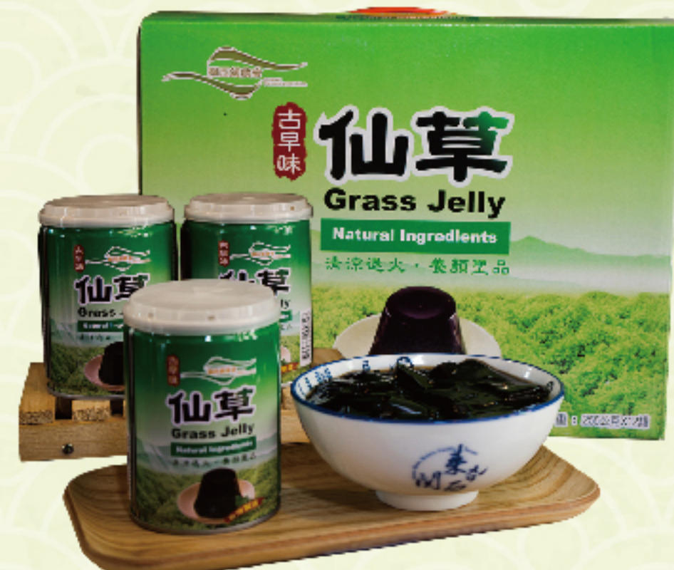
新竹關西 古早味仙草凍禮盒 (12入/盒) 特價 399 元 售價420元