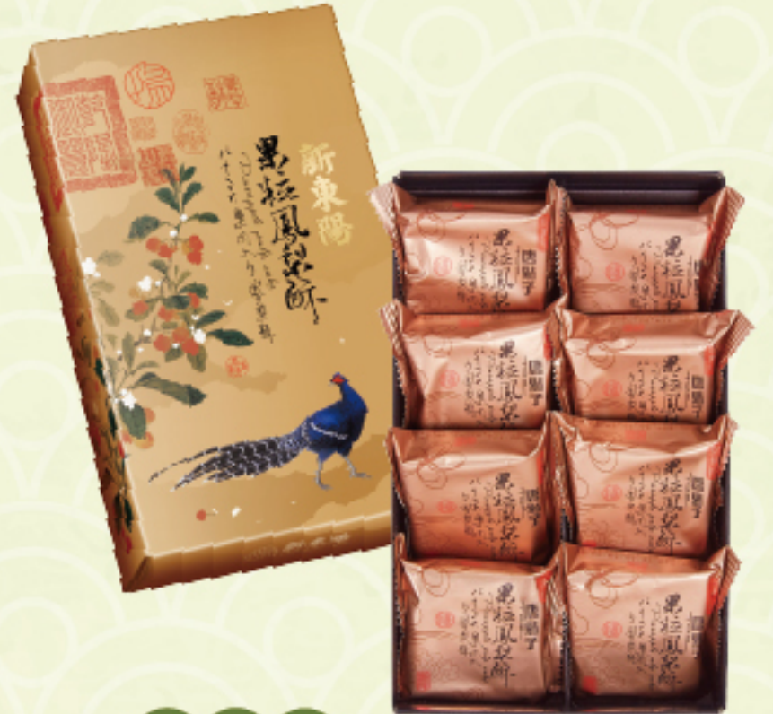
奶蛋素 果粒鳳梨酥 (8入/盒) 售價 360 元