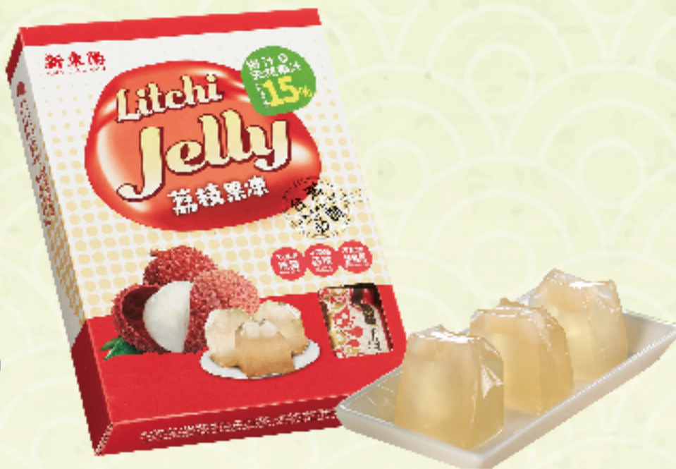
台灣果品荔枝凍 (10入/盒) 售價100元