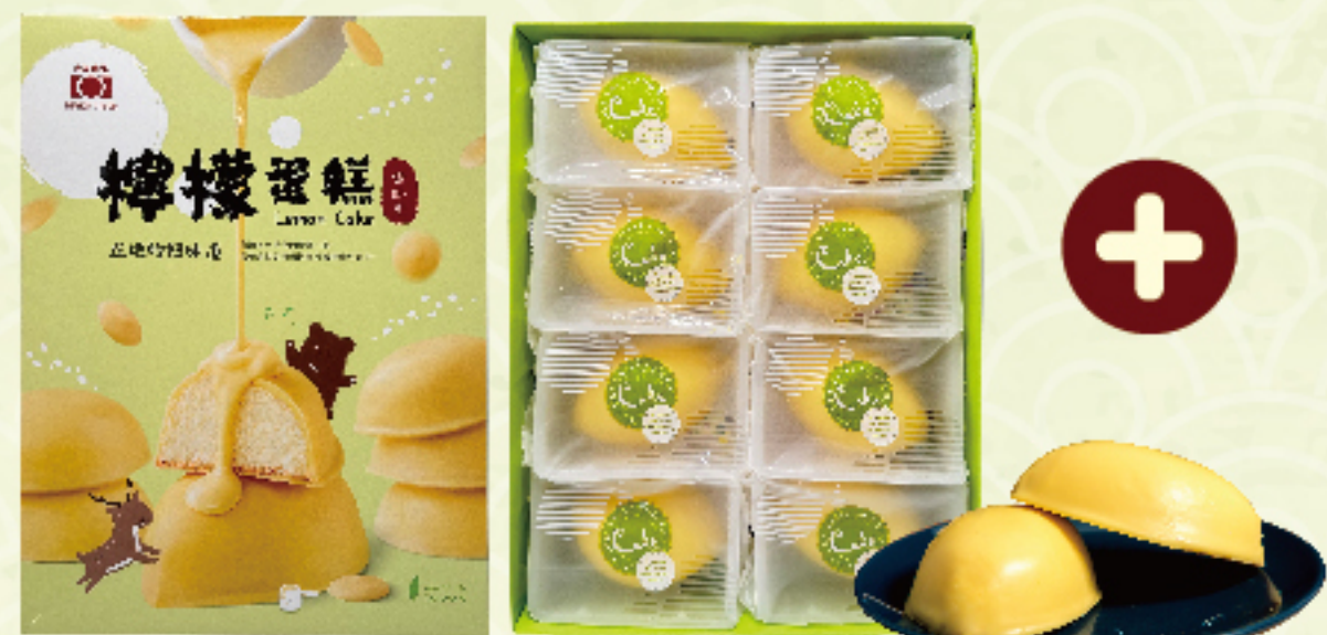
台中老太陽堂檸檬蛋糕 (8入/盒) 售價300元 外層微脆的檸檬巧克力包覆著鬆軟 綿密的檸檬蛋糕，口感清爽不甜膩