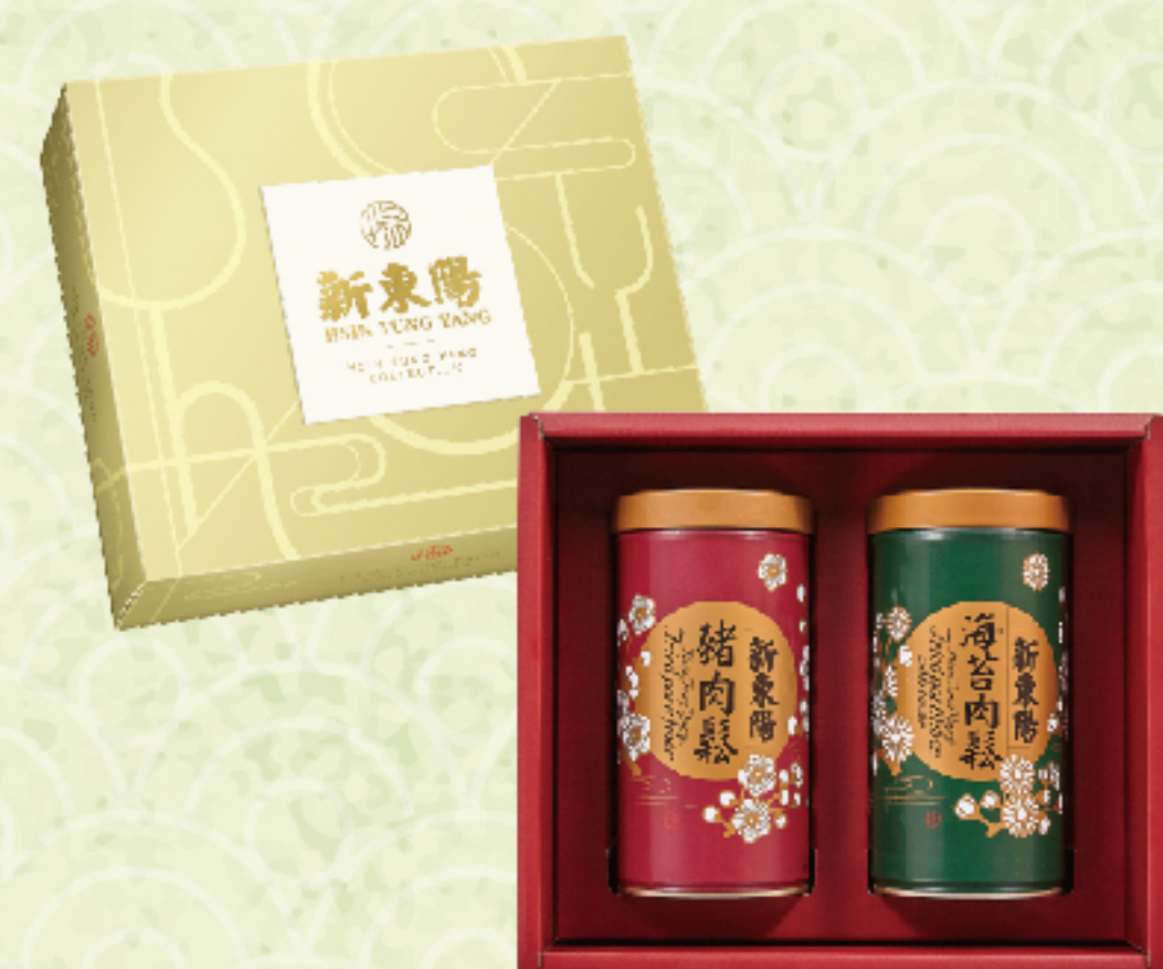
典雅尊貴禮盒2號 售價 750 元 豬肉鬆、海苔肉鬆