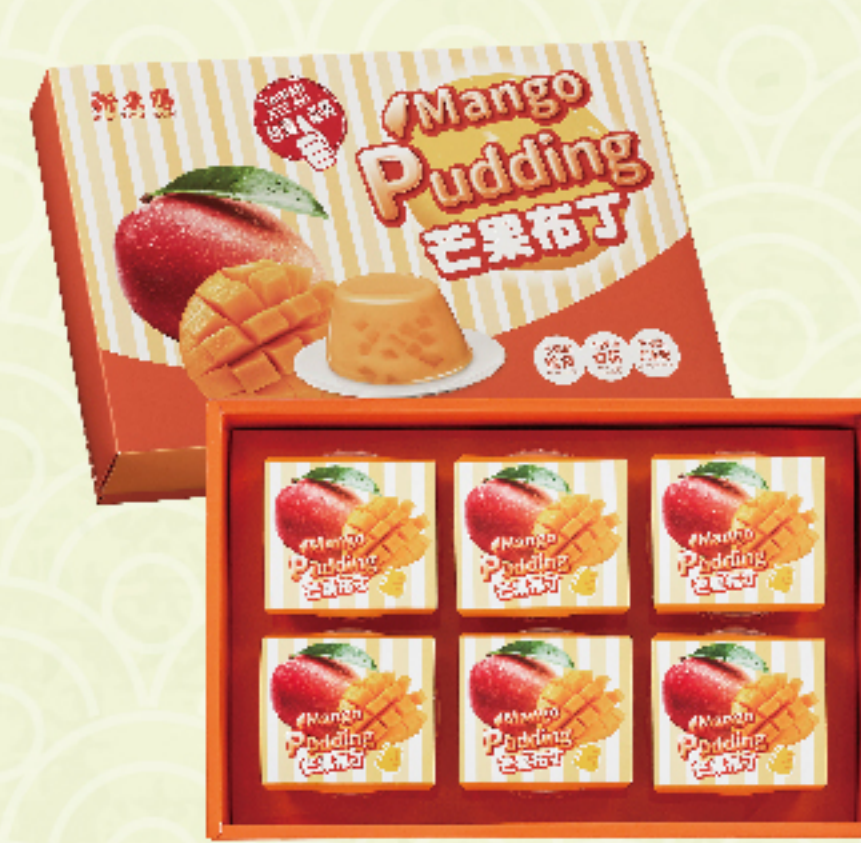
芒果風味布丁 (6入/盒) 特價 199 元 售價235元 香濃芒果泥 × Q彈椰果 軟嫩Q彈入口即化，散發濃郁芒果香氣的布丁讓人越吃越想吃。