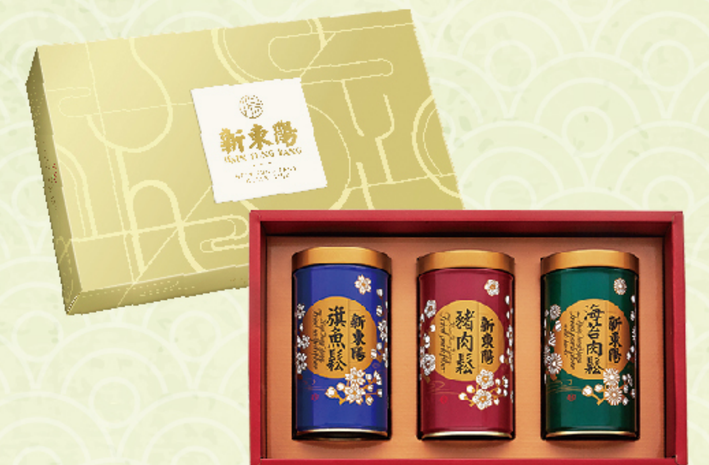
典雅尊貴禮盒3號 售價 1040 元 旗魚鬆、豬肉鬆、海苔肉鬆