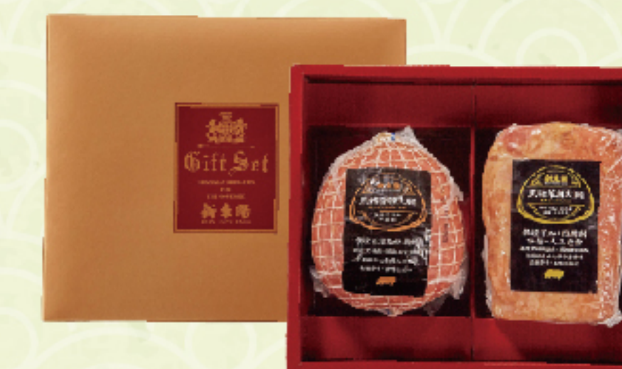
西式肉品禮盒1號 需冷藏