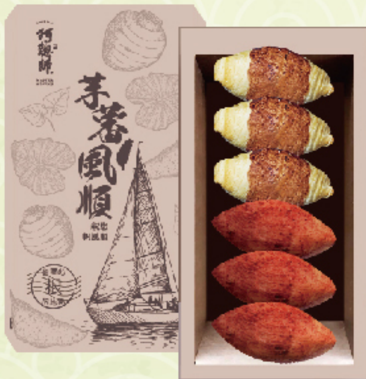
台中阿聰師 芋蕃風順禮盒 (6入/盒) 售價 390 元 小芋仔、蕃薯餅