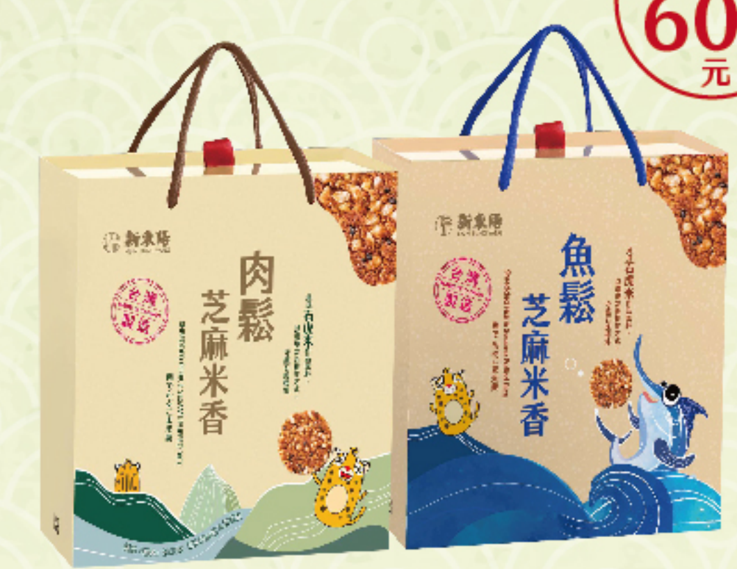
芝麻米香禮盒-肉鬆/魚鬆 (24入/盒) 特價 320 元 售價360元