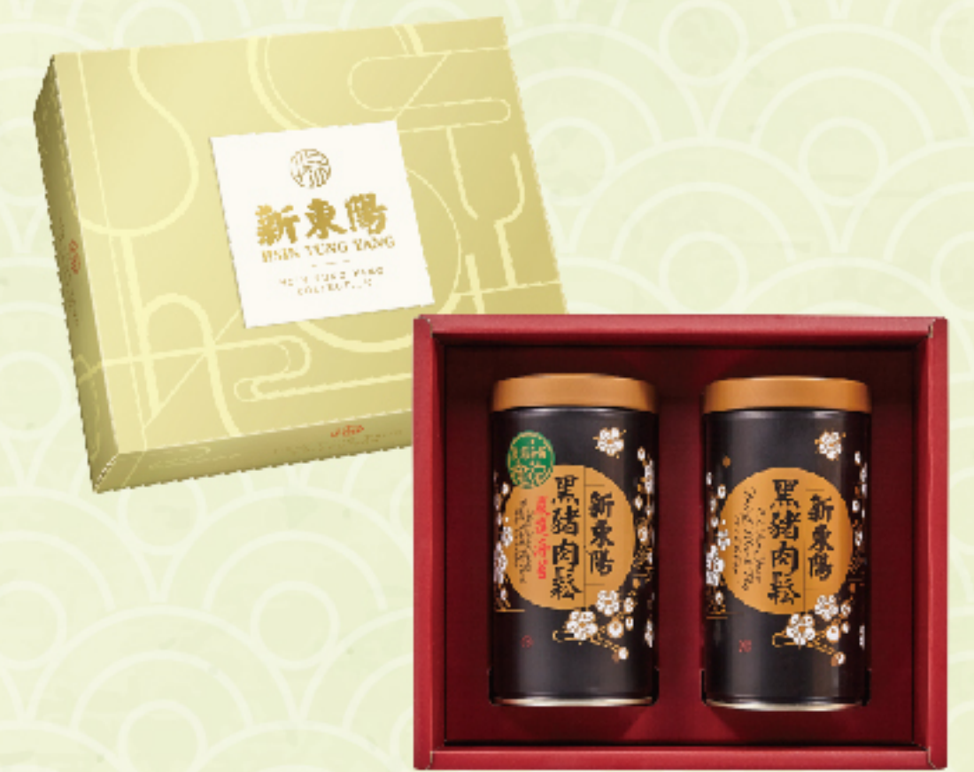
典雅尊貴禮盒1號 售價 820 元 黑豬海苔肉鬆、黑豬肉鬆