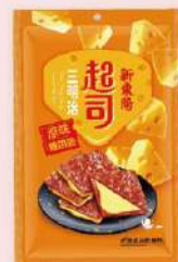
起士三明治豬肉乾 (180g/包) 白金會員價 199元 售價295元