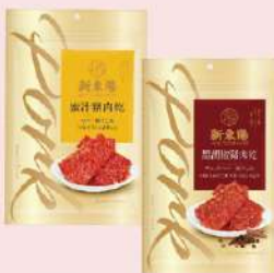
豬肉乾-蜜汁/黑胡椒 (240-275g/包) 會員價 235元 售價295元