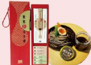
嘉義東和製油無添加麵線麵條禮盒 香蔥麵條3組、麻油薑絲麵線3組 白金會員價 399元 售價480元