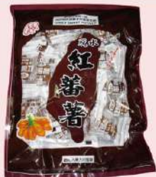
竹山鎮脫水紅蕃薯 (200g/包) 會員價 89元 售價100元