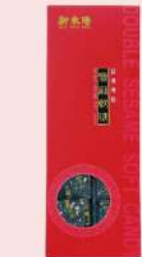
雙麻軟糖 (220g/盒) 會員價 165元 售價200元