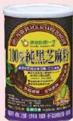
康迪一生100%純黑芝麻粉 (454g/罐) 會員 買一送一 售價380元