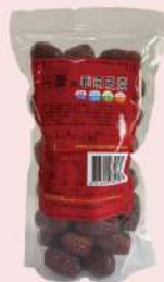
光薰和田玉棗 (500g/包) 會員價 259元 售價400元