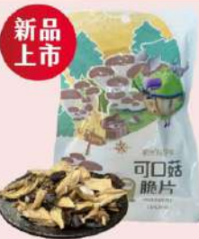
彰化魔菇部落 黑美人菇餅-鹽味 (60g/包) 售價120元