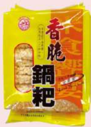
四方香脆鍋粿 (200g/包) 會員價 65元 售價85元