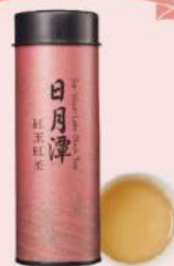
新東陽日月潭紅茶包 (10入/罐) 售價400元