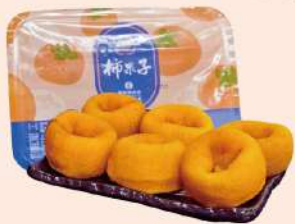
番路鄉農會 柿菓子柿餅(480g/盒) 特價 180元 售價200元

特價 99元 售價120元 選用宜蘭米+阿里山「青心烏龍茶」 巧妙地融入每一片米菓，無添加人工香精。 採用直火烘焙，非油炸商品。