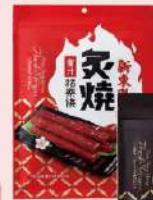
炙燒豬樂條-蜜汁/黑胡椒 (165g/包) 售價295元