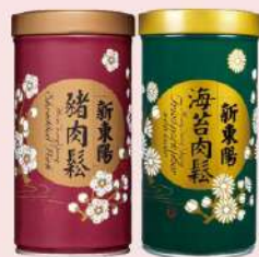
豬肉鬆-原味/海苔 (255g/罐) 白金會員價 250元 售價335元