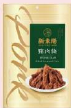
豬肉條 (210g/包) 會員價 235元 售價295元