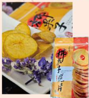
番路鄉農會柿菓子脆片 原味(110g/包)

特價 99元 售價120元 嚴選來自番路鄉所產牛心柿， 經脫澀、洗淨、切片、乾燥而成。 無添加防腐劑、人工色素及人工香精。