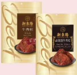
牛肉乾-高粱酒/紅酒 (200g/包) 會員價 235元 售價295元