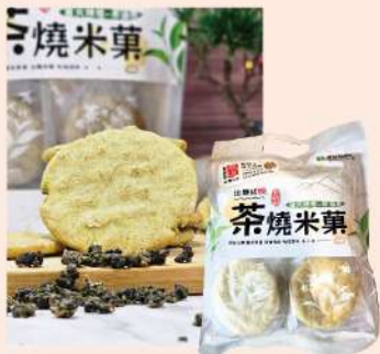
番路鄉農會茶燒米菓(120g/包)

特價 99元 售價120元 嚴選來自番路鄉所產牛心柿， 經脫澀、洗淨、切片、乾燥而成。 無添加防腐劑、人工色素及人工香精。