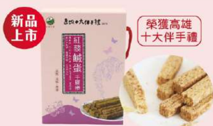
高雄得樂紅藜鹹蛋千層棒 (216g/盒) 白金會員價 129元 售價150元