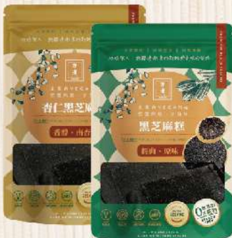
亦擇黑芝麻糕-原味/杏仁(250g/包) 任選買1送1 $259