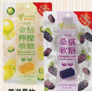
美滋果物 果汁軟糖-桑椹/金桔檸檬(100g/包) $79 $89