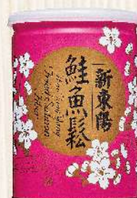
鮭魚鬆(180g/罐) $168 $220