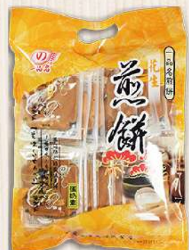
彰化一品名花生煎餅(340g/包) $95 $120