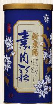
素肉鬆(280g/罐) $239 $290