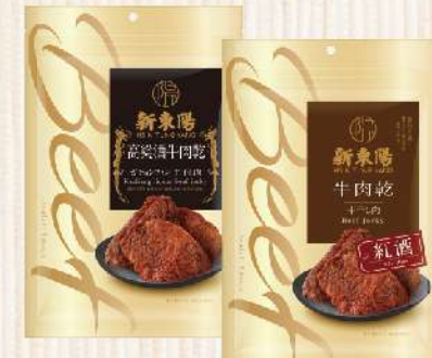
牛肉乾-高粱酒/紅酒(200g/包) $255 $295