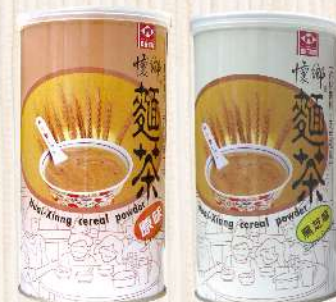
高雄枝仔冰城懷鄉麵茶-原味/黑芝麻(550g/罐) $129 $185