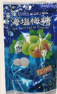
南投信義鄉農會海鹽梅糖(100g/包) $69 $89