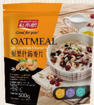
紅布朗堅果什錦麥片(500g/包) $165 $300