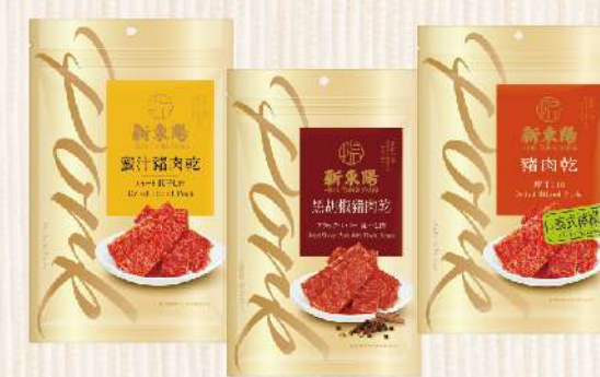
豬肉乾-蜜汁/黑胡椒/泰式檸檬(210-275g/包) $255 $295