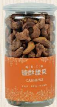
越南八婆鹽酥帶皮腰果(340g/罐) $289 $320