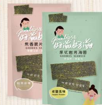
好滋好滋 焦香脆片海苔-原味/椒鹽(45g/包) $129 $150