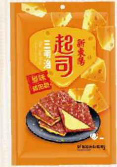
起司三明治豬肉乾(180g/包) $255 $295