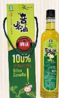
南投縣農會冷壓苦茶油(500ml/盒) $850