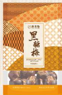
黑糖梅(140g/包) $69 $80