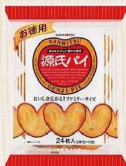
日本三立源氏派(240g/包) $119 $150