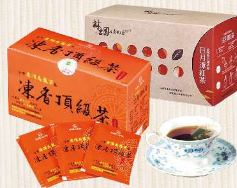
林吉園茶包-紅茶/烏龍茶(30入/盒) 任選買1送1 $250元