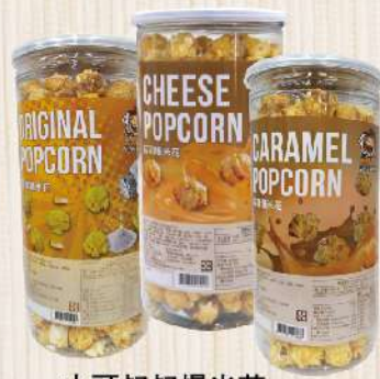
大頭叔叔爆米花 焦糖/原味/起司(200g/罐) $89 $109