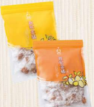
橘之鄉貴妃金橘-甜/鹹(300g/包) $169 $200