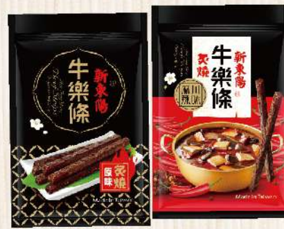
炙燒牛樂條-原味/川味麻辣(150g/包) $255 $295