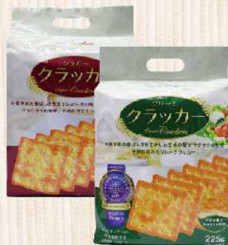
滿足威蘇打餅 原味/甜味(225g/250g/包) $69 $75