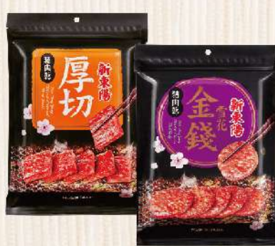
豬肉乾-厚切/雪花(200g/包) $210 $270