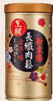
長纖黑豬純肉鬆(160g/罐) $268 $335