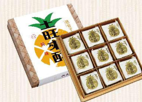
土旺來酥(9入/盒) $370 $450