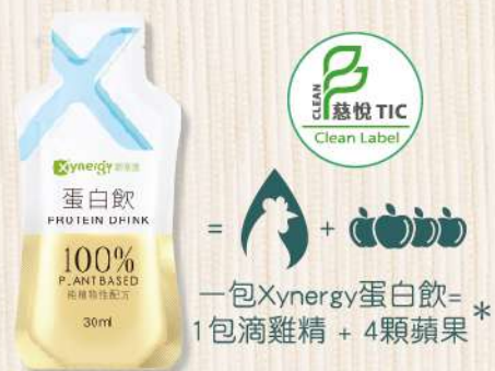
Xynergy蛋白飲(30ml/包) $95 $150 一包Xynergy蛋白飲= * 1包滴雞精 + 4顆蘋果