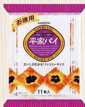
日本三立餅乾-葡萄味(148.5g/包) $119 $150