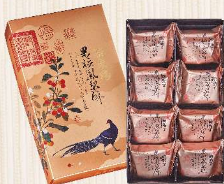
果粒鳳梨酥(8入/盒) $298 $360