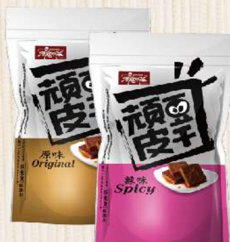
頑皮豆干-原味/辣味(25g*8/盒) $149 $200