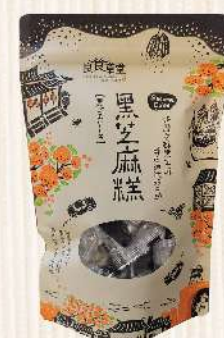
台南良食草堂黑芝麻糕(200g/包) $190