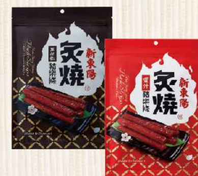
炙燒豬樂條-蜜汁/黑胡椒(165g/包) $255 $295