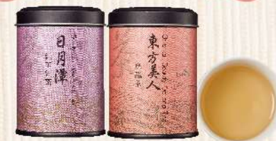
新東陽日月潭紅茶/東方美人茶(10g/罐) $110 $160