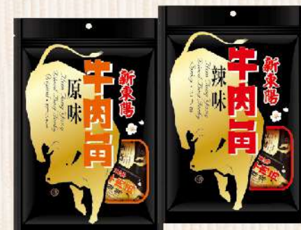
牛肉角-原味/辣味(210g/包) $255 $295