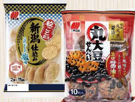
日本三幸丸大豆旨鹽仙貝(125g/包) 日本三幸新瀉仕選醬油米果(125g/包) 任選買1送1 $139