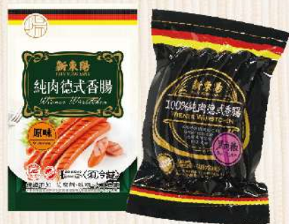
德式香腸-原味/黑胡椒(160g/包) $75 $88