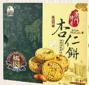
澳門媽閣杏仁餅(225g/盒) $199 $250