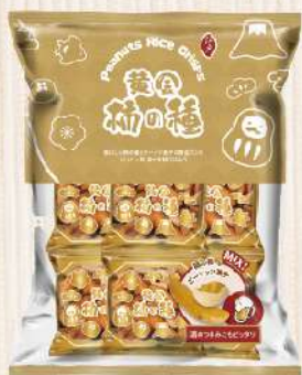
日本江戶柿種米果(204g/包) $189 $235