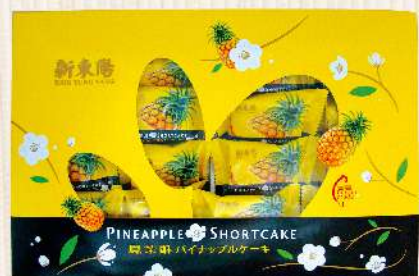
鳳梨酥(16入/盒) $230 $280