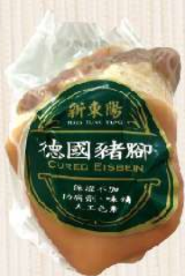
德國豬腳零秤(hg/顆) $50 $55