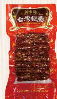
原味台灣臘腸(300g/包) $175 $200