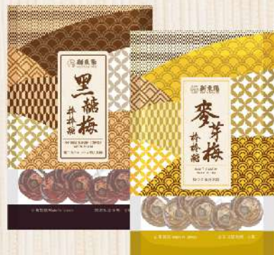
棒棒糖-黑糖梅/麥芽梅(168g/包) $85 $100