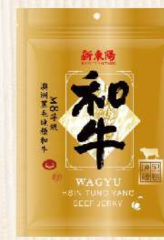
和牛肉乾(120g/包) $360 $420