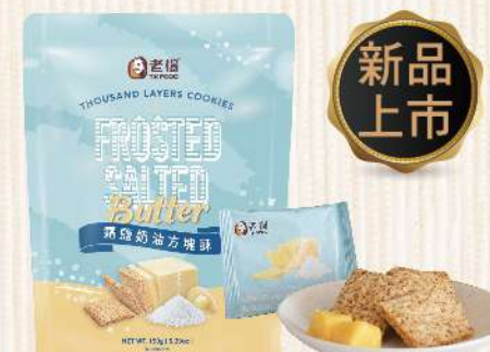
嘉義老楊霜鹽奶油方塊酥(150g/包) $89 $110