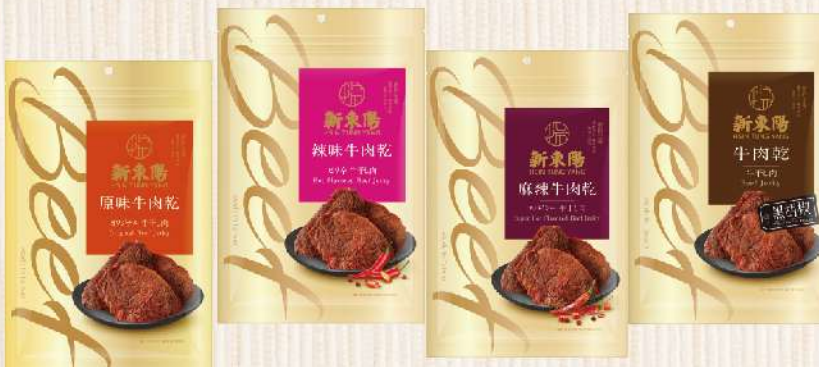
牛肉乾-原味/辣味/麻辣/黑胡椒(210g/包) $255 $295