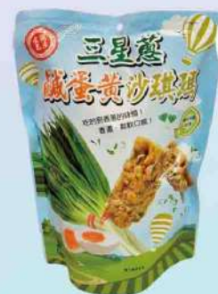
鑫富皇三星蔥鹹蛋黃沙琪瑪(234g/包) $129 $150