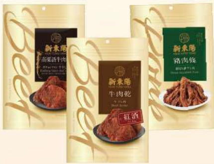
牛肉乾-高粱酒/紅酒(200g/包)/ 豬肉條(210g/包) $265 $295