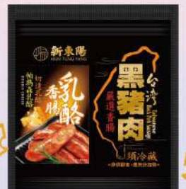
黑豬乳酪香腸(300g/包) $215 $250