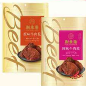
牛肉乾-原味/辣味(210g/包)$295