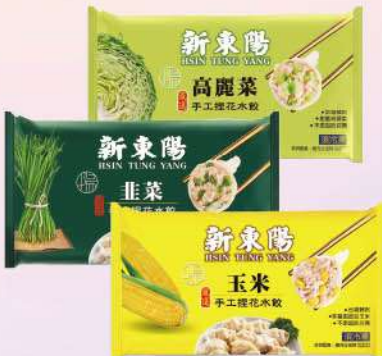
手工捏花水餃-高麗菜/韭菜/玉米(660g/包) $159 $199