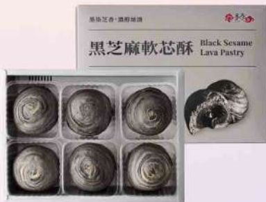
薏泰黑芝麻軟芯酥(6入/盒) $320