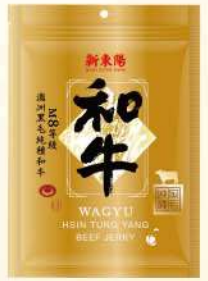
和牛肉乾(120g/包) $380 $420