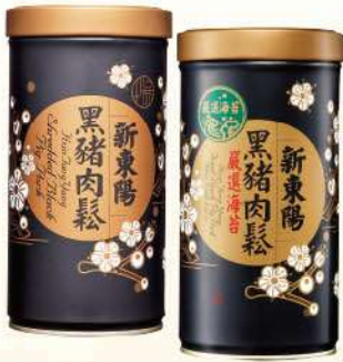
黑豬肉鬆-原味/海苔(255g/罐) $319 $370