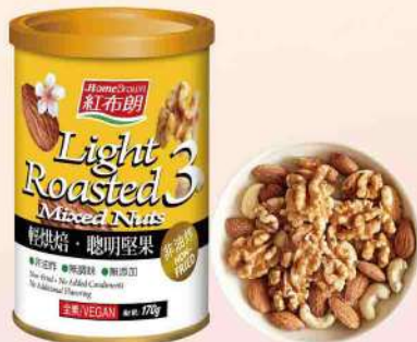
紅布朗輕烘焙聰明堅果(170g/罐) $229 $300