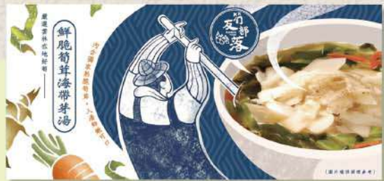
雲林古坑原味竹筍三秒沖泡、無添加負擔，以最純粹的台灣風味迎接旅途。