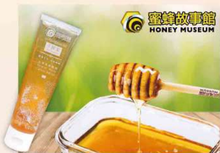
蜜蜂故事館-荔枝手壓蜜(80g/條)$139