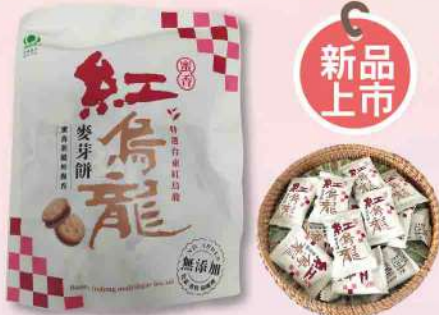
嘉禾蜜香紅烏龍麥芽餅(200g/包) $129 $150