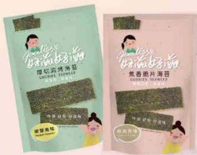
好滋好滋厚切岩烤海苔-原味/海苔椒鹽(45g/包) $150