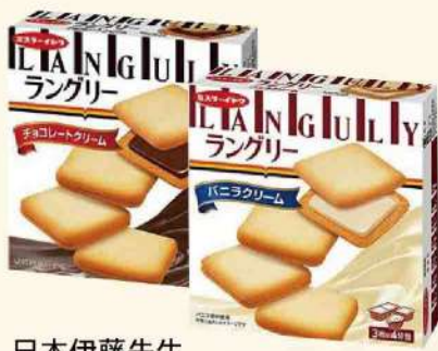
日本伊藤先生 夾心餅乾-巧克力/香草(132g/盒) $69 $99