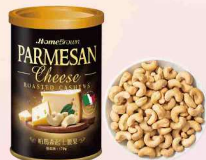
紅布朗帕瑪森超士腰果(170g/罐) $289 $360