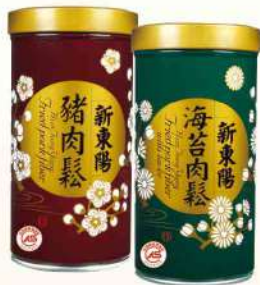
豬肉鬆-原味/海苔(255g/罐)$335