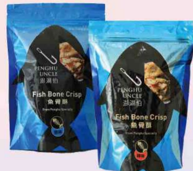
澎湖伯魚骨酥-原味/辣味(100g/包) $109 $120