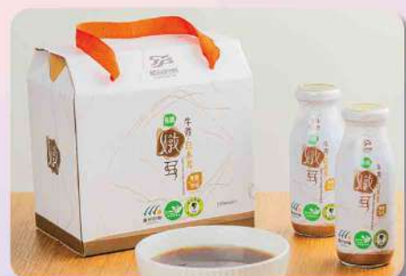
植品良食有機牛蒡根燉耳無糖禮盒(195ml/6入盒) $420