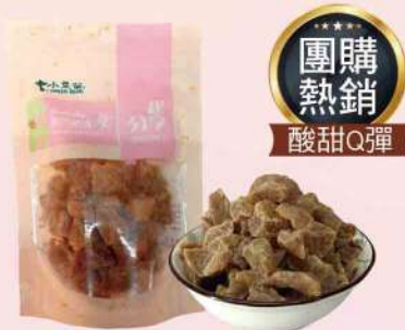
小豆苗黯然銷魂果(120g/包)$60