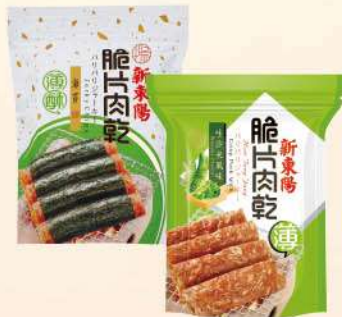
脆片豬肉乾-海苔/哇沙米風味(75g/包) $180 $200