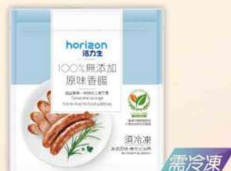
無添加原味香腸(300g/包) $220