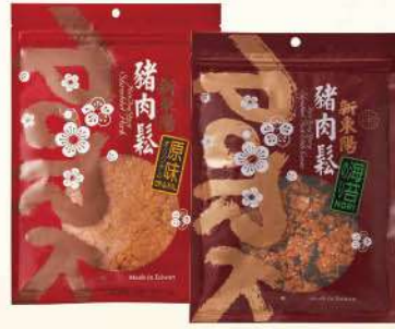
豬肉鬆隨手包-原味/海苔(250g/包) $229 $265