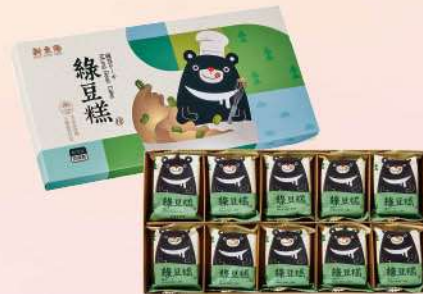
SUNNY熊綠豆糕禮盒(10入/盒) $299 $350