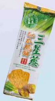
鑫富皇三星蔥地瓜脆餅(90g/包) $35 $40