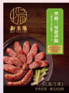
黑豬三星蔥香腸盒(360g/盒) $260 $285