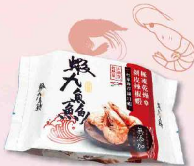
台東蝦九蠶剝皮辣椒蝦(25g/包) $119 $139