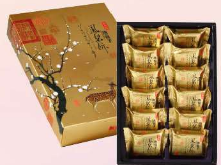
精緻鳳梨酥(12入/盒) $360 $420