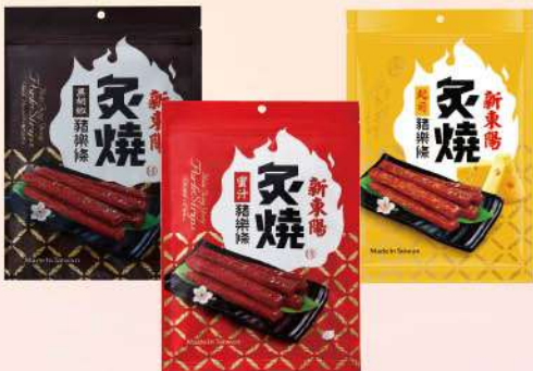
炙燒豬樂條-蜜汁/黑胡椒/起司(165g/包) $265 $295