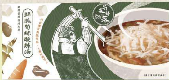
來自台灣雲林古坑的鮮脆竹筍湯，最道地的台灣伴手禮。

無漂白、無添加防腐劑、無鹽的原味熟脆筍片筍絲精心特製多種優質蔬菜湯頭，營養盡在其中。