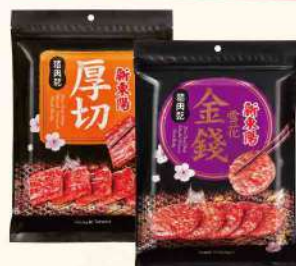
豬肉乾-厚切/雪花(200g/包) $270