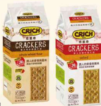
義大利 克里奇義大利蘇打餅-鹽味/多穀(500g/包) $119 $159