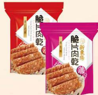
脆片豬肉乾-杏仁/櫻花蝦(75g/包) $165 $185