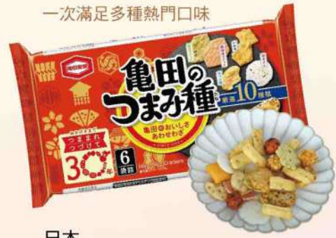
一次滿足多種熱門口味 日本 龜田十種類米果點心(120g/包) $109 $159