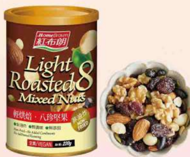
紅布朗輕烘焙八珍堅果(220g/罐) $259 $320