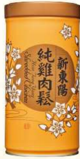
純雞肉鬆(225g/罐) $288 $335