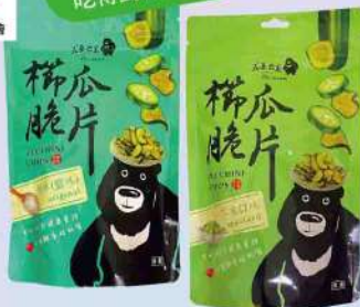
南投仁愛農會柳瓜脆片-原味/芥末(70g/包) $159 $180